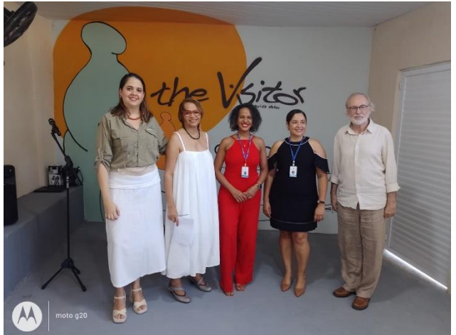
VERTEGENWOORDIGERS VAN SOWITEC