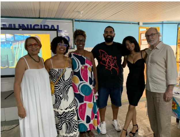
TJDENS DE RECEPTIE