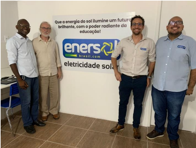
VERTEGENWOORDIGERS VAN ENERSOL