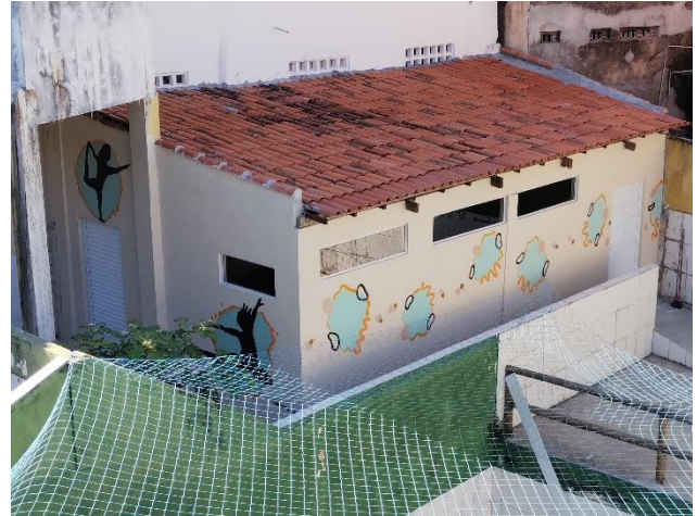
Het danslokaal, voor en na